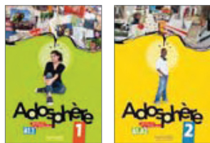
ADOSPHERE 1 ET 2 Pour adolescents Niveaux A1 et A1 > A2