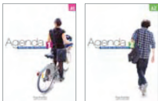
AGENDA 1 ET 2 Pour grands adolescents et adultes Niveaux A1 et A2