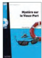
LFF 6 nouveaux titres avec CD pour enrichir cette collection à succès ! Niveaux A1 - A2 - B1